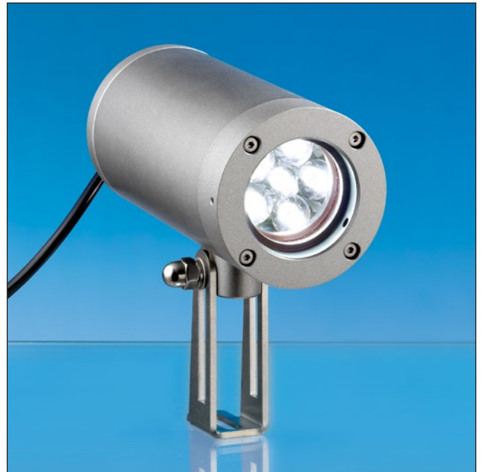
Lumistar Leuchte ASL55LED-Ex