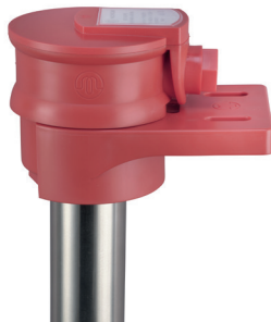
Winkelbadwärmer mit Halter HWB

Die Winkelbadwärmer ROTKAPPE setzen sich aus dem beheizten waagrechten Tauchrohr mit Longlife-Heizeinsatz, dem unbeheizten senkrechten Tauchrohr, dem Klemmgehäuse und der Leitung zusammen.